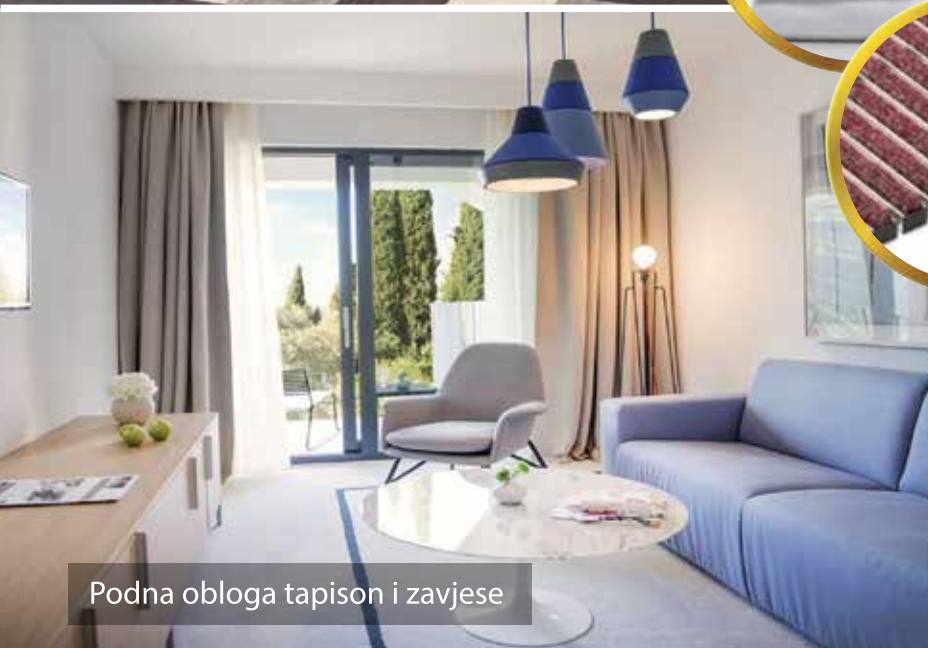
Podna obloga tapison i zavjese